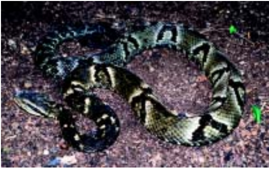
Figura 6. A jararaca comum do continente ( Bothrops jararaca ) é diferente, na coloração, de sua 'parente' insular (na fase juvenil, tem a ponta da cauda clara)

densidade da espécie na ilha é tão grande que em apenas um dia é possível encontrar até 60 dessas serpentes. No continente, em contraste, estudos realizados na mata atlântica nos últimos 15 anos encontraram no máximo três jararacas comuns por dia. A superpopulação de jararacas-ilhoas na ilha da Queimada Grande pode decorrer da quase ausência de predadores de serpentes e da grande disponibilidade de alimento.