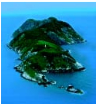
Figura 1. O habitat da jararaca-ilhoa é a ilha da Queimada Grande, ao largo do litoral sul de São Paulo

A jararaca-ilhoa foi descrita em 1921 pelo herpetólogo Afrânio do Amaral (1894-1982), do Instituto Butantan. Em 1959, o zoólogo belga Alphonse R. Hoge (1912-1982) e colaboradores, também do Butantan, relataram a presença em várias fêmeas do órgão copulador do macho (hemipênis), com tamanho reduzido, e as chamaram de intersexos. Sabe-se agora que são fêmeas verdadeiras e o órgão é denominado