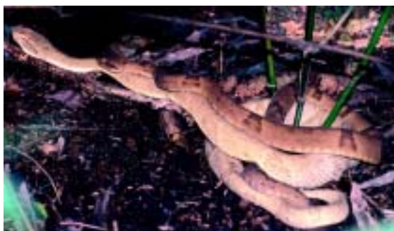
Figura 10. Dois indivíduos de jararaca-ilhoa durante o ritual de cortejar, que precede o acasalamento