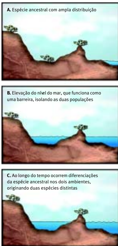
Figura 7. Modelo de especiação alopátrica, decorrente do isolamento de uma ilha em função da elevação do nível do mar

A jararaca-ilhoa parece acasalar-se entre março e julho (figura 10), e os filhotes nascem nos primeiros meses do ano. A taxa de natalidade parece ser baixa, pois uma ninhada de jararaca-ilhoa raramente ultrapassa 10 filhotes, enquanto a da jararaca comum pode chegar a 30. Além disso, poucas fêmeas prenhes foram registradas durante os estudos na ilha.