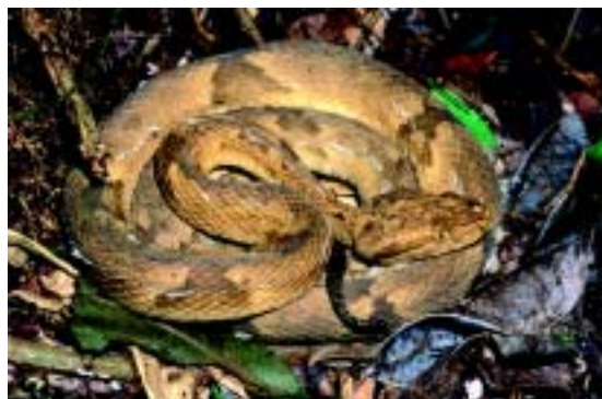
Figura 4. Embora permaneça mais tempo sobre a vegetação, a jararaca-ilhoa ( Bothrops insularis ) às vezes é encontrada no chão da mata

Um modelo para explicar a diferenciação entre a jararaca-ilhoa e a do continente é a especiação alopátrica. Segundo esse modelo, duas populações separadas por alguma barreira geográfica podem sofrer diferenciação ao longo do tempo, tornando-se espécies distintas. Um cenário desse tipo pode ter dado origem à jararaca-ilhoa. O nível do mar sofreu oscilações no período Quaternário, criando em vários momentos passagens secas entre a ilha e o continente. Possivelmente, em um desses momentos havia apenas uma espécie ancestral de jararaca. Com a elevação do nível do mar, uma população teria ficado