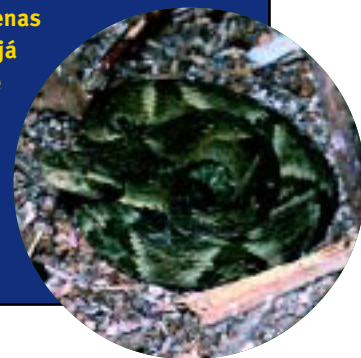
Figura 8. A jararaca-de-alcatrazes ocorre apenas na ilha dos Alcatrazes, ao largo do litoral norte de São Paulo

Tais pressões, associadas ao fato de estar restrita a uma pequena ilha, fazem com que a jararaca-ilhoa seja considerada uma espécie ameaçada de extinção. Embora sua densidade populacional seja grande, um incêndio que atingisse a ilha inteira poderia eliminar todos os indivíduos. Com base nesses argumentos, os autores recomendaram à União Mundial para a Conservação da Natureza (IUCN) a inclusão da B. insularis na categoria 'criticamente ameaçada' na edição de 2000 da Lista Vermelha de Espécies Ameaçadas ( www.redlist.org ). A jararaca-ilhoa também faz parte das listas oficiais de espécies da fauna ameaçada de extinção do estado de São Paulo e do Brasil.