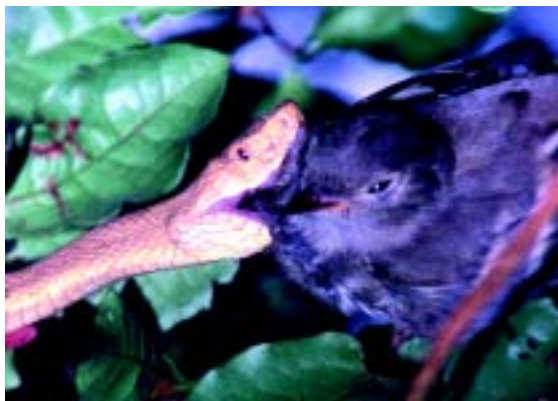
Figura 9. A jararaca-ilhoa ingerindo um dos pássaros de sua dieta, o tuque ( Elaenia mesoleuca )

Embora a maior parte da ilha da Queimada Grande esteja preservada, existem áreas desmatadas no passado, hoje cobertas por capim. Ao longo dos últimos sete anos, tais áreas voltaram a ser invadidas pela mata, mas sua recuperação total deve demorar muitos anos. Além dessa ameaça, aparentemente controlada, há evidências de capturas ilegais de jararacas-ilhoas, provavelmente para o mercado negro de animais silvestres.