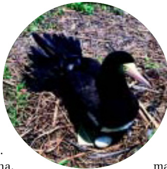
Figura 2. O atobá Sula leucogaster – com ovos, em seu ninho – é a ave marinha mais abundante na ilha

Várias aves marinhas freqüentam a ilha: a fragata ( Fregata magnificens ), o gaivotão ( Larus dominicanus ), o trinta-réis (gênero Sterna ) e, principalmente, o atobá ( Sula leucogaster ), que faz ninhos ali (figura 2). Além das aves marinhas, cerca de 30 espécies de pássaros, a maioria migratórias, são avistadas na ilha em certas épocas do ano. Também há pássaros residentes, como a corruíra ( Troglodytes aedon ) e a cambacica ( Coereba flaveola ).