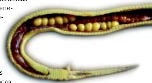
Figura 5. Fêmea de jararaca-ilhoa dissecada, mostrando os folículos ovarianos e o órgão denominado hemiclitéris